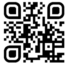
QR-Code zur Webseite