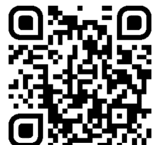
QR-Code zur Bewertung